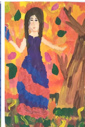
Рисунок Кузнецовой Екатерины