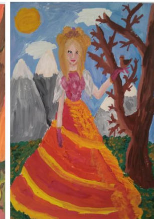
Рисунок Дерябиной Алины