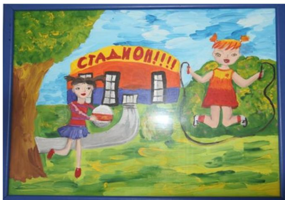
Рисунок Гидревич Софии