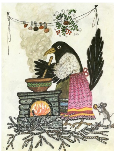
«Сорока-белобока», Васнецов М. В.

Детям во время каникул или при наличии свободного времени можно попробовать поэкспериментировать в новом жанре искусства. Для этого понадобится прочитать сказку, рассказ, стихотворение. Возможно, уже есть излюбленное произведение. Выбрать какой-нибудь интересный момент, героев и постараться их нарисовать. Главное – это передать особенности героев (добрый, злой, высокий, низкий, во что одет), характерные особенности персонажей. Не надо забывать про фон, где происходит действие - какой пейзаж, погода, время суток, на улице или в помещении находятся