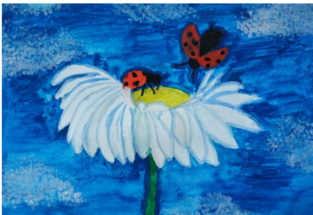
Рисунок Маркус Евы