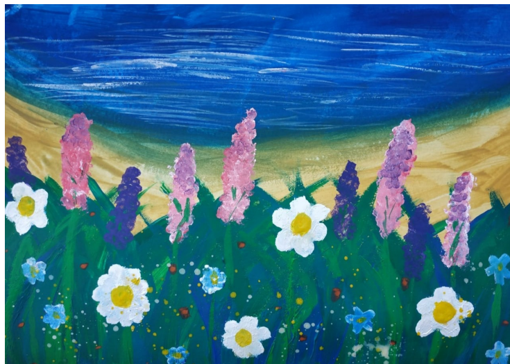
Рисунок Гидревич Софии