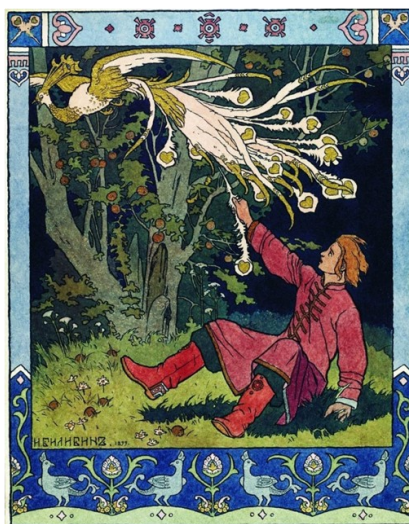
«Иван-царевич и Жар-птица» Билибин И. Я.

герои. Подойдут любые материалы для исполнения: гуашь, акварель, цветные карандаши, фломастеры. Иллюстрация может стать увлекательным способом провести время, поводом для совместного творчества с друзьями, шагом к выбору будущей профессии.