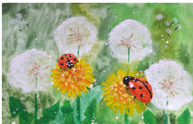
Рисунок Гидревич Софии