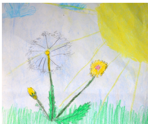
Рисунок Гончаренко Лилии